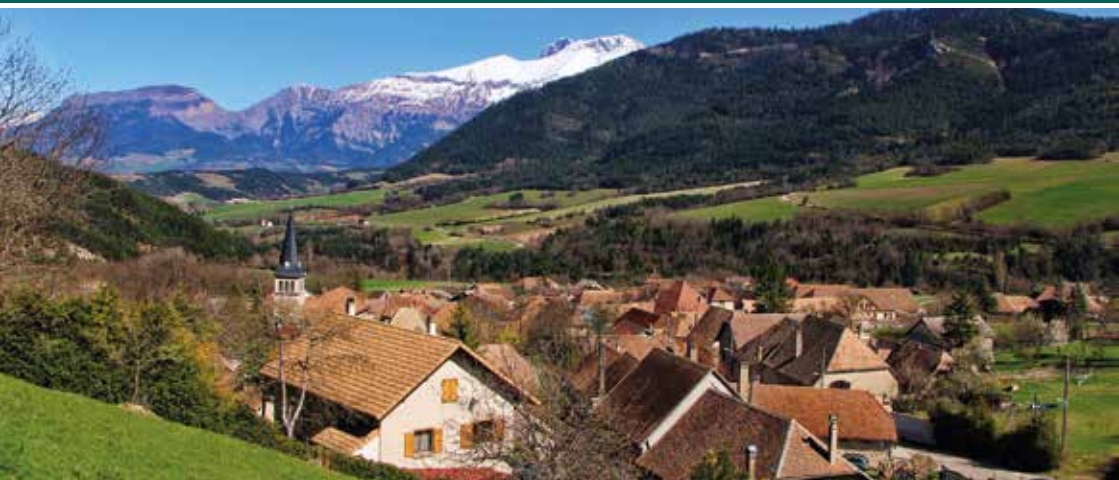
Le village de Lalley