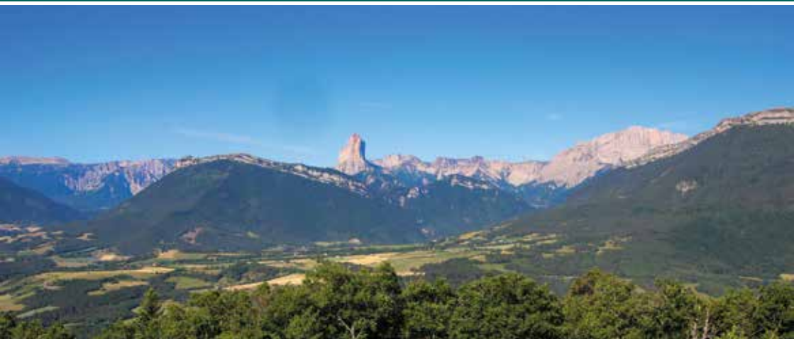
Vue sur le Vercors avec le Mont Aiguille et à droite une partie du Grand Veymont