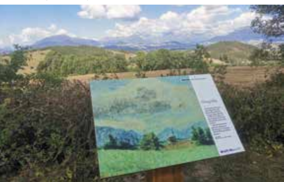
Panneau sur le sentier thématique Berger - Giono