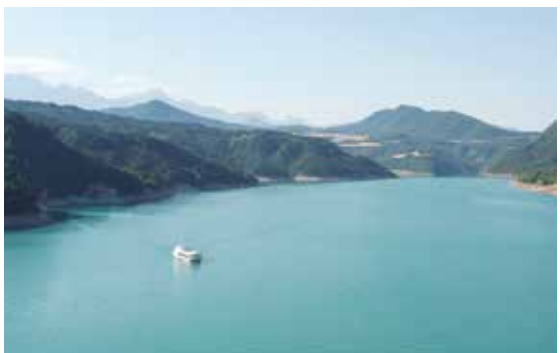
Le bateau La Mira sur le lac de Monteynard