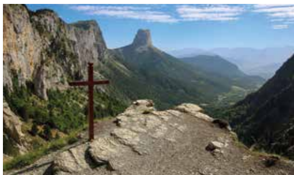
Une croix sur le sentier du Pas de l'Aiguille