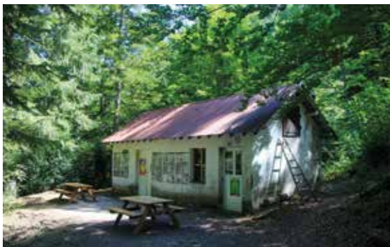
Cabane du pique-nique du Grand Ferrand