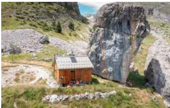
Cabane de Pierre Baudinard