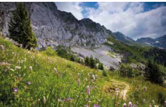
Du côté du Col Vert