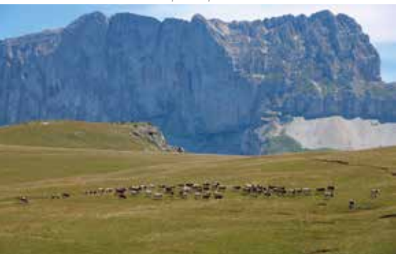
Pâturage près du Col de la Croix