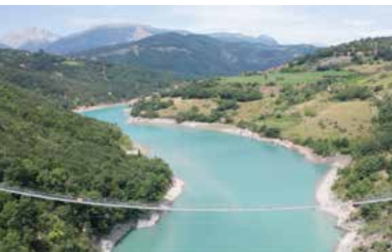
La passerelle himalayenne du Drac