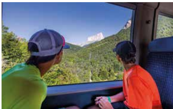
Vue depuis le train (ligne Grenoble - Gap) en arrivant sur Clelles