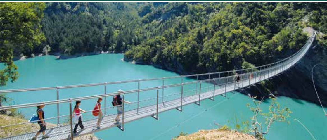
La passerelle himalayenne de l'Ébron