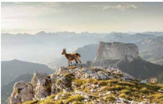
Vue depuis le sommet du Grand Veymont