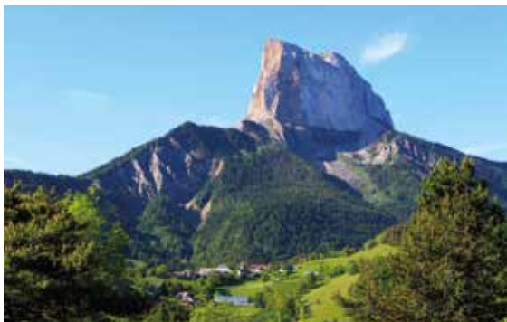
Le hameau de La Bâtie et le Mont-Aiguille