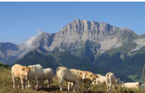
Troupeau de vaches au Serpaton