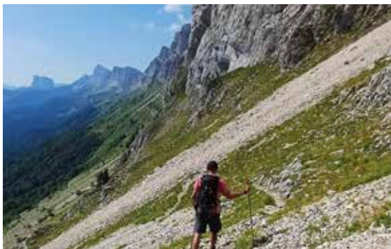
Randonneur sur le sentier du Balcon Est du Vercors