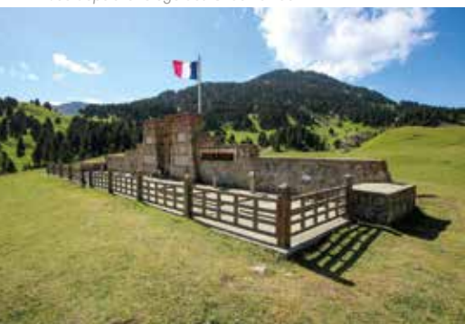
Nécropole nationale de la résistance au Pas de l'Aiguille