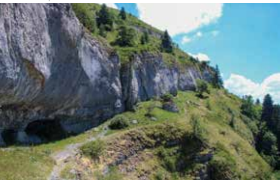
Vire légèrement aérienne sous le sommet.