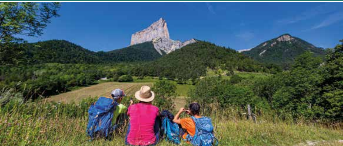
Le Mont Aiguille