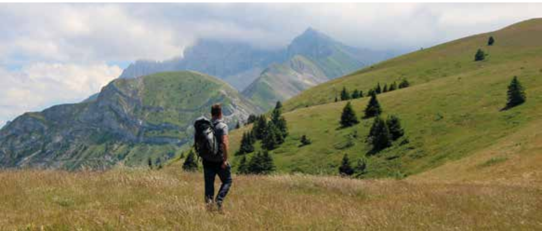
Vue depuis le sommet du Châtel