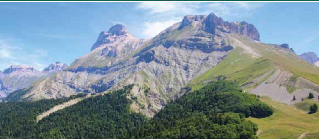
Vue du Grand Ferrand depuis la pointe feuillette