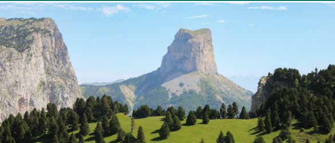
Vue depuis le refuge des Chaumailoux