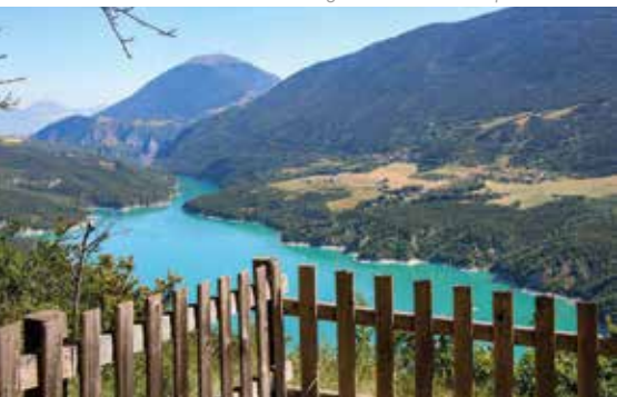
Vire sur le lac de Monteynard - Avignonet