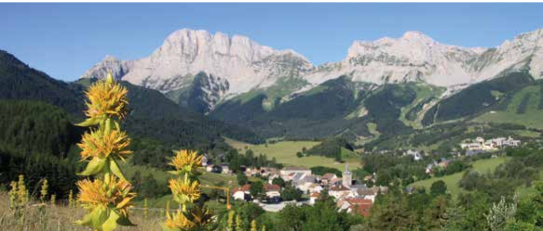
Gresse en Vercors et le Grand-Veymont