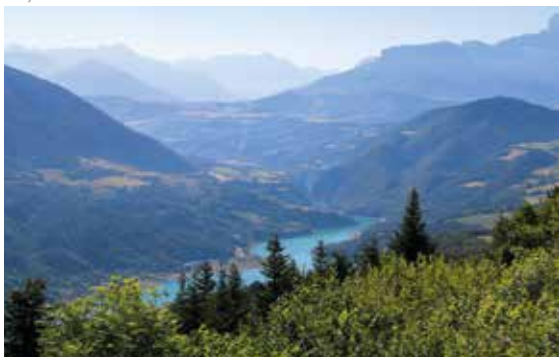
Vue Sud Est avec le lac de Monteynard - Avignonet