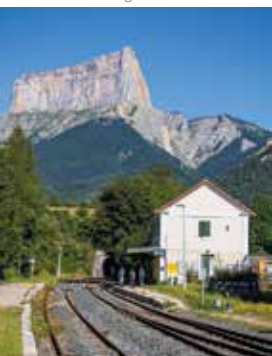
Depuis la gare de Clelles