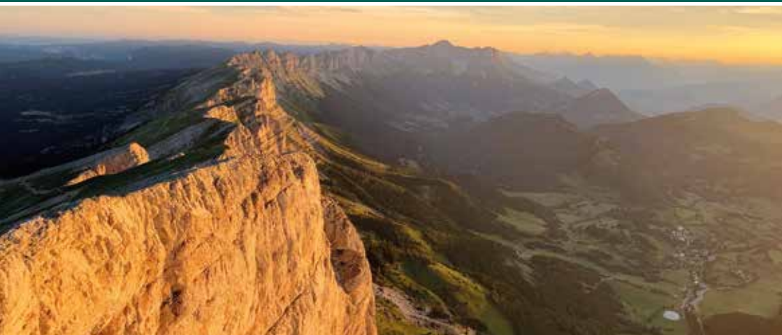
Vue sur les sommets, le balcon Est du Vercors et Gresse-en-Vercors. À gauche, les hauts-plateaux