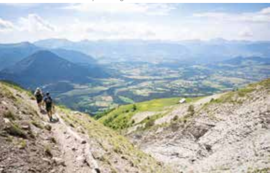
Passage de ravines près de Casse Varnage