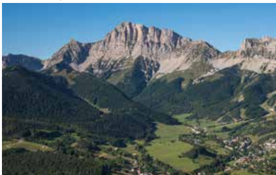
Gresse-en-Vercors et le Grand Veymont