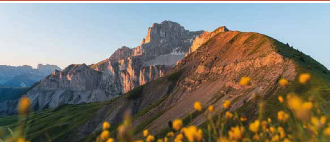
Vue sur l'Obiou depuis l'Aiguille